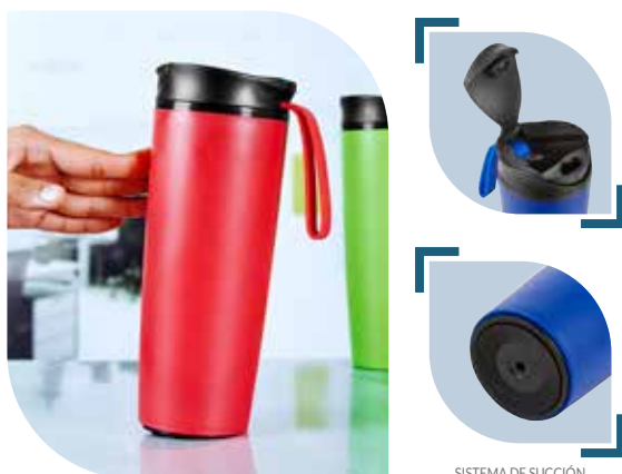
SISTEMA DE SUCCIÓN