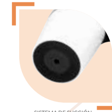
SISTEMA DE SUCCIÓN